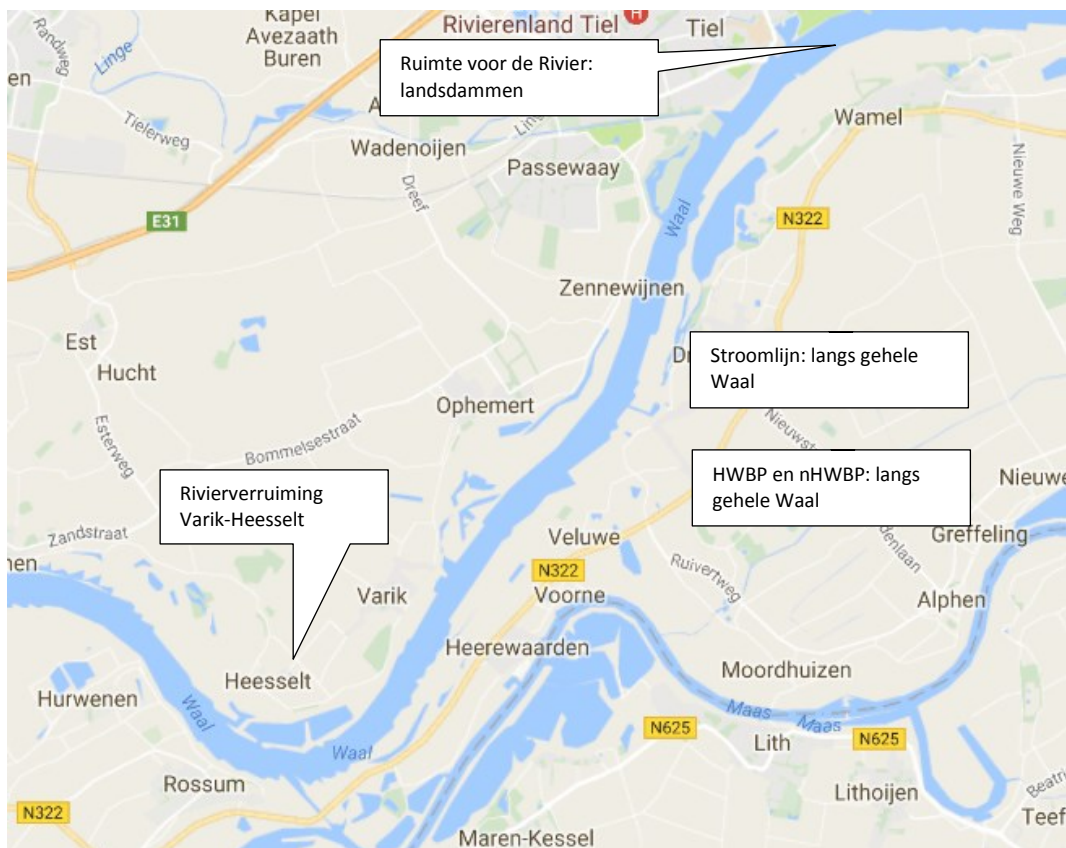
Figuur 2.2: Projecten in de omgeving.